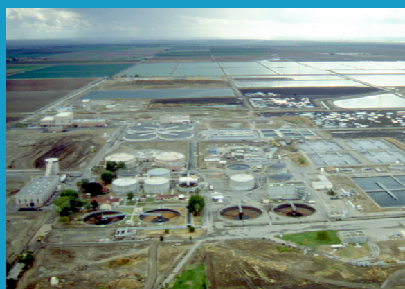
Fresno-Clovis Regional Wastewater Reclamation Facility