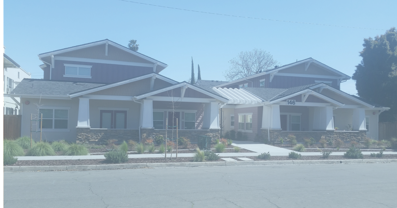
146 N. Glenn HOME Project